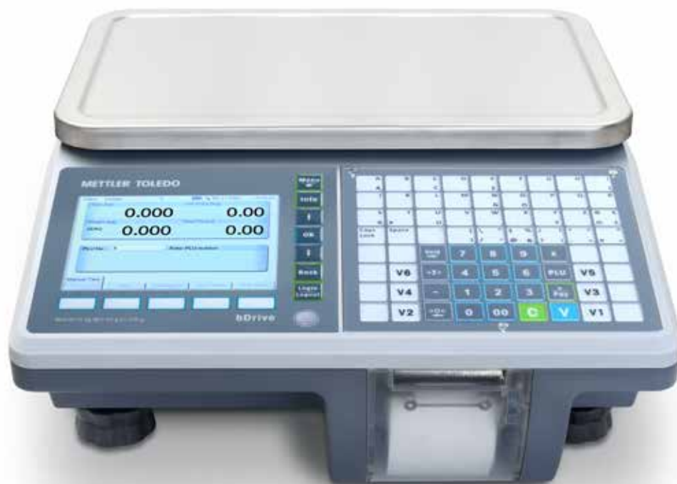
Balance compacte bDrive

Effectuant des pesées rapides et précises, le système bDrive de METTLER TOLEDO est une balance de comptage polyvalente multifonctions avec imprimante ticket, destinée à un usage en magasin ou en itinérance. Se démarquant par sa rapidité et sa robustesse, la bDrive effectue des processus de pesage complets et performants qui réduisent les temps d'attente des clients, même dans les environnements difficiles.